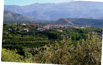
Mirador de los Guitarras