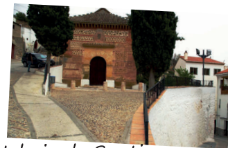
Iglesia de Santiago