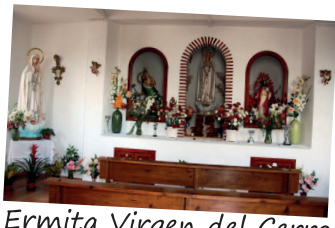
Ermita Virgen del Cerro