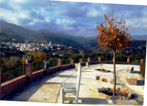
ador de las Alvirillas