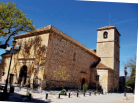
ia San Juan Evangelista