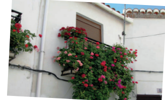
Calles y casas encaladas