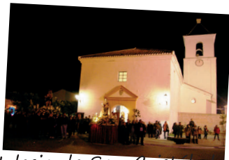
Iglesia de San Cristobal