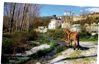
Entorno del Río Saleres