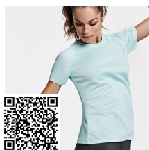
BAHRAIN WOMAN CA0408