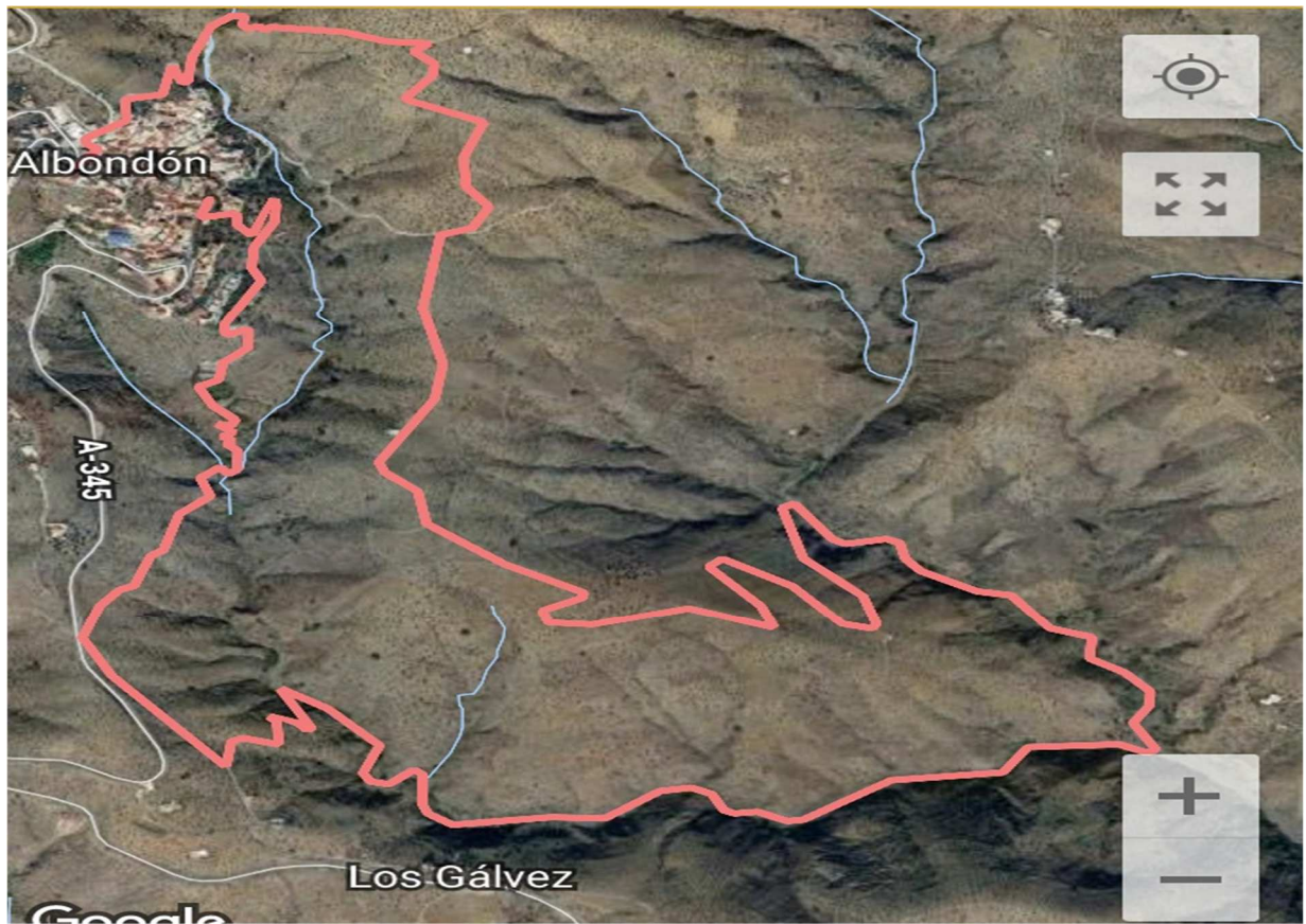
CARRERA POR MONTAÑA CORTA 9 KM