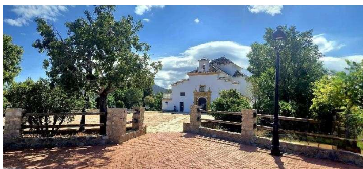
Ermita patrona de Dílar y Sierra Nevada Nuestra Señora la Virgen de las Nieves

Todo el dinero recaudado en este evento se destina a las asociaciones VALE y UAPO . Gracias a los pedaleos de los participantes, así como, a la colaboración de patrocinadores en este evento se contribuirá en todas las acciones y actuaciones que realizan estas asociaciones y son tan necesarias.