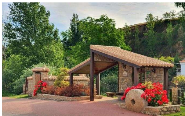
Entrada principal a Dílar

Dílar está organizando el mayor evento BENÉFICO de ciclo indoor del área metropolitana de Granada. A tan sólo 12km de Granada, en la plaza Mirador de la Sierra de Dílar, se darán 4 clases de ciclo indoor con 4 instructores profesionales de gran nivel de varias partes de España sobre un escenario, habrá un mínimo de 100 bicicletas estáticas, equipo de sonido de 4000w, parking, comida, bebida, mochila con obsequios a participantes, premios y muchas sorpresas más. Es el primer evento de este nivel que se organiza y se espera que sean muchas ediciones más. Existirá la posibilidad de inscribirse en bicicleta CERO, donde se participa sin reserva de bicicleta.