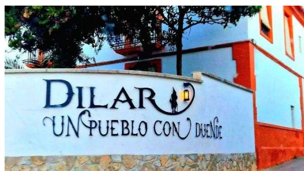
Enseña entrada de Dílar , un pueblo con Duende.